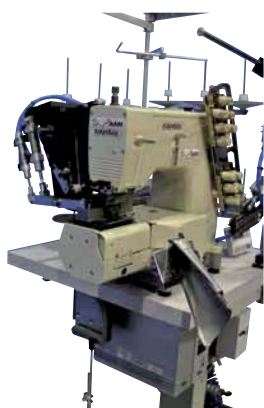
Cylinder arm unit, full lubricate, made by Kansai Japan