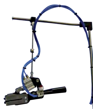
Option: pneumatic scissor device - ref. code CD001