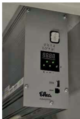
Common control box for all units