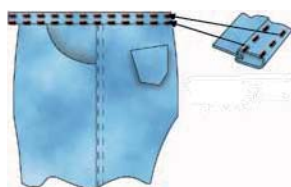
Sample of waistband