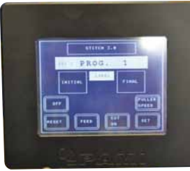
Touch screen - friendly use