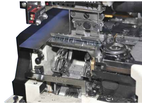
6044-SPFLEX: loopers and rotary hook view