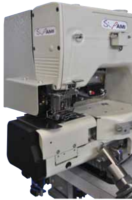
Cylinder arm unit, full lubricate, made by Kansai Japan