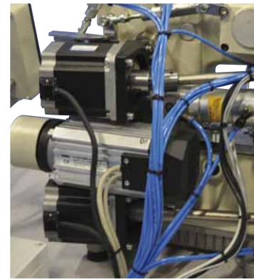
Double electronic puller device