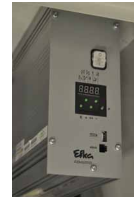
Common control box for all units